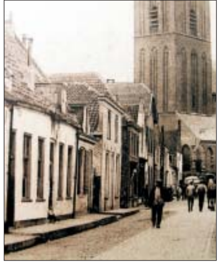
'De Goude Leeuw'. In 1790 genoemd en in 1918 Bussumerstraat 24 (tweede woning links). Vervangen door moderne woningen.