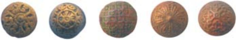
Knopen uit de 16de eeuw.