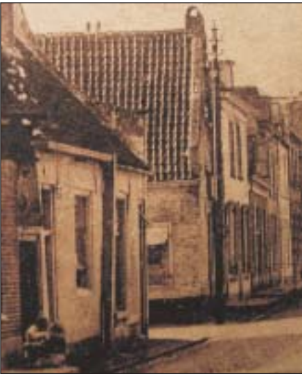
'Het Vosje'. Stond in 1880 op de hoek Kloosterstraat/Jan Massenstraat (hoekhuis links). Afgebroken.