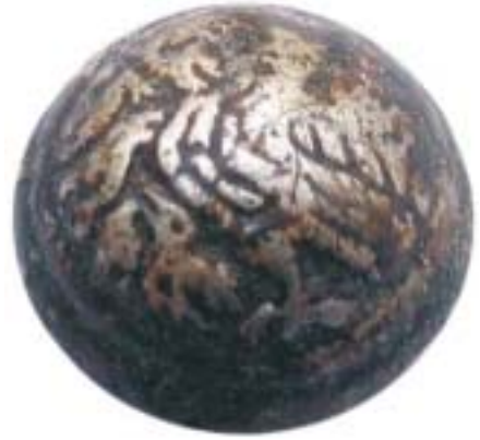
Roofvogel met jong. Ware grootte 12 mm.

De vijf jongere knopen die in dit artikel worden afgebeeld, vonden ook nog hun oorsprong in de 17de eeuw. Ze kwamen in het derde kwart van die eeuw in de mode en werden tot ver in de 18de eeuw geproduceerd. De hier getoonde exemplaren zijn van binnen hol. Ze bestaan, op het goudkleurige bolletje na, uit drie delen: een kapje, een afdekplaatje en een gemonteerd oogje. In het afdekplaatje zit een kleine ronde opening waardoor de lucht kon ontsnappen als beide delen aan elkaar werden gelast. In de volksmond werden deze knopen aangeduid als 'boerenknopen', waarschijnlijk omdat ze veel werden gedragen op het zondagse tenue van de plattelandsbevolking.