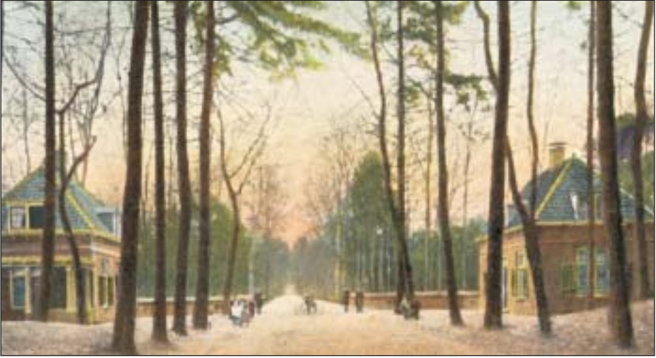
'... de karakteristieke huisjes van de Hofstede Oud-Bussum.' (Ze staan er nog).