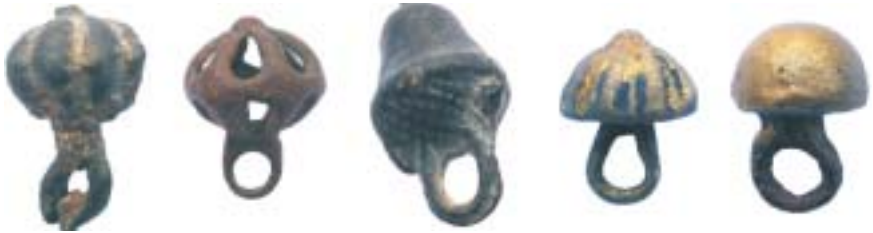
Op bedeltjes gelijkende 16de-eeuwse knopen.

Een echte knopenrage ontstond pas in de 17de eeuw. Een enorme afwisseling in versieringspatronen kenmerkt de knopencollectie uit die eeuw. Blad-, bloem-, ransen-, raster- en vlechtbanddecoraties treffen we in vele varianten aan. Ook komen,