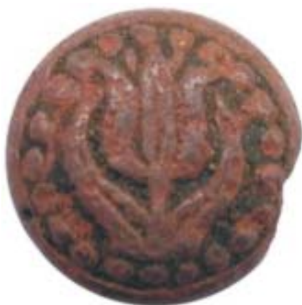
Tulp in parelrand. Ware grootte 12 mm.