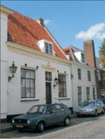
'De Kamer'. Stond in 1726 in de Voorstraat. Nu Turfpoortstraat 10.