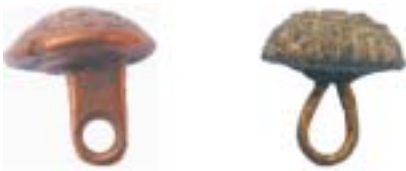
Knoop met een doorboorde staaf als oog (16de eeuw) en een met een draadoog (17de eeuw).

Kenmerkend voor de 16de-eeuwse knopen is een doorboorde staaf als oog. In dezelfde tijd komt ook al een draadoog voor, maar dat type wordt pas karakteristiek voor de 17de eeuw. Ook de grootte van de knoop kan bepalend zijn voor de ouderdom. Zo kwamen omstreeks 1575 relatief grote knopen (2 cm doorsnede) in de mode. De aard van de versiering van de knoop geeft ook een belangrijke indicatie. Knopen met fleurons (bloemen) in een banddecoratie behoren bijvoorbeeld tot de oudere producten. Naarmate we verder in de tijd komen, wordt de bloem in het hart van de knoop steeds groter.