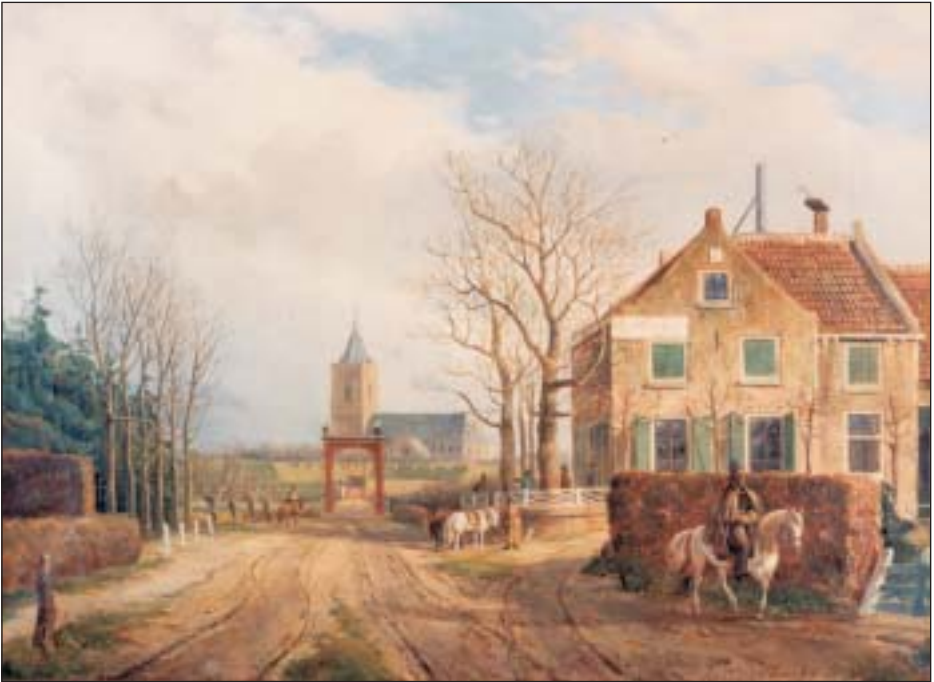
Het logement Zandbergen voor de verwoesting in 1813, geschilderd door Jan van Ravenswaaij naar een tekening van Jacob Bolten.