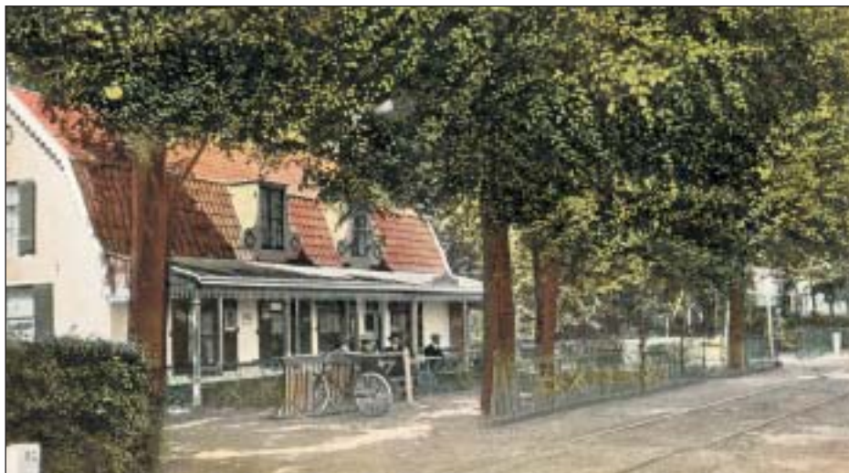
De Gooische Boer, vanouds een herberg ...? (In 1970 gesloopt bij de aanleg van de A 1; op de plek staat nu een autobedrijf).

De Amersfoortsestraatweg was toen nog een betrekkelijk smalle weg met aan de westzijde de baan van de Gooische Stoomtram. Trottoirs waren er niet, maar dat was ook niet nodig want je kon nog rustig midden op de met klinkers bestrate weg wandelen. Aan de oostzijde van de weg werd in de diepte nog zand gewonnen bij