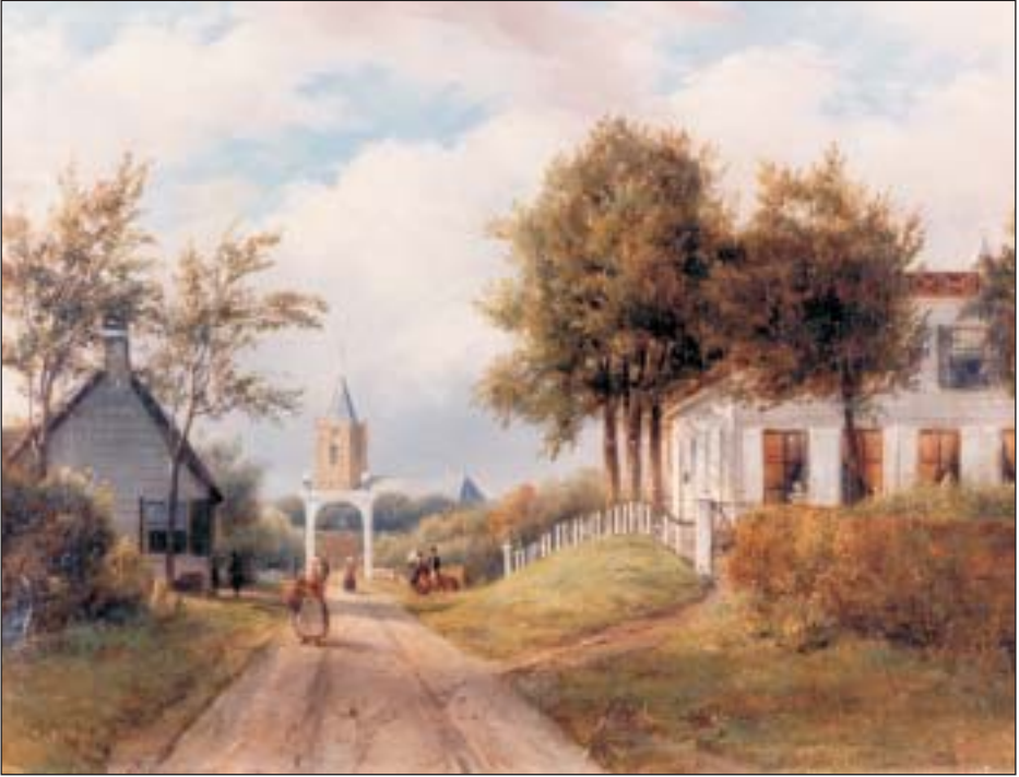
Zandbergen na de herbouw ten tijde van Van Rossum. Aan de andere kant van de weg staat het tolhuis. Schilderij van Jan van Ravenswaaij.