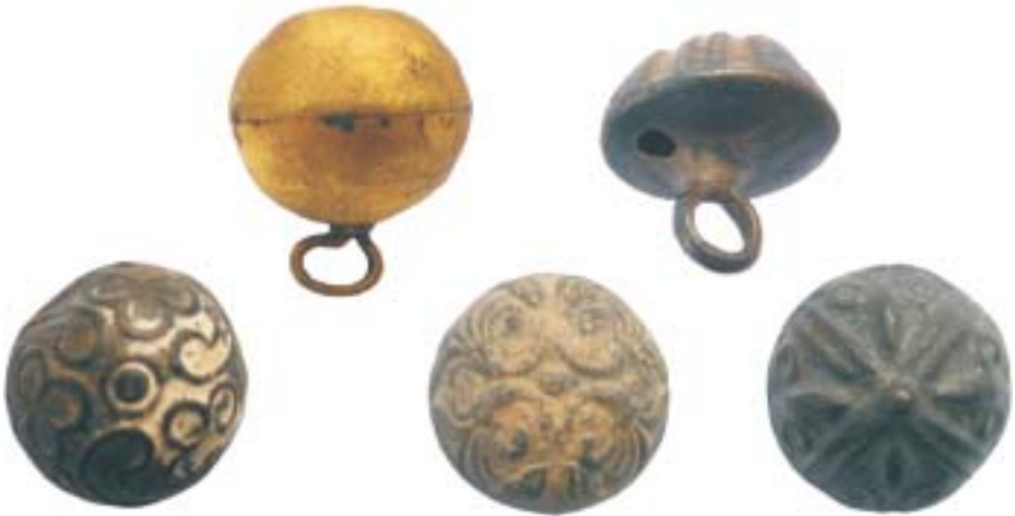
Laat 17de-eeuwse knopen.