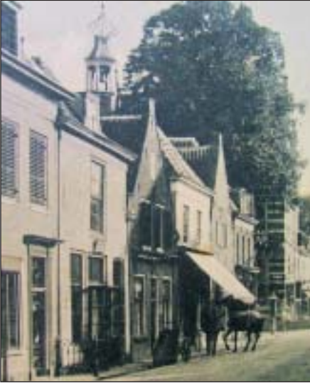
'Deventer'. Stond in 1709 op de Vis-marckt (het pand met de openstaande deuren). Nu een restaurant op Marktstraat 30.