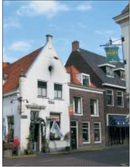
'De Vergulde Swaan'. Stond in 1743 op de hoek Marktstraat/Schipperstraat. Nu Marktstraat 52 (café Demmers).