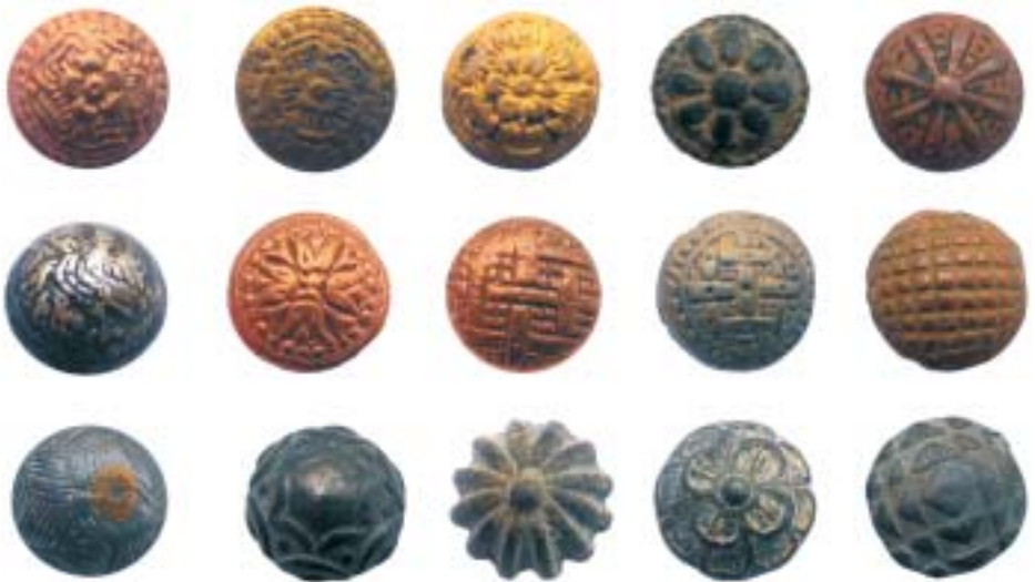
Knopen uit de eerste helft van de 17de eeuw. De tudorrozen, fleurons, vogel, tulpen, vlechtband- en andere decoraties zijn slechts een kleine greep uit de versieringspatronen van de 17de eeuw.

Een echte knopenrage ontstond pas in de 17de eeuw. Een enorme afwisseling in versieringspatronen kenmerkt de knopencollectie uit die eeuw. Blad-, bloem-, ransen-, raster- en vlechtbanddecoraties treffen we in vele varianten aan. Ook komen,