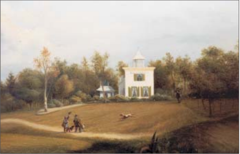
De belvédère Flevorama, geschilderd omstreeks 1845. Na het overlijden van Van Rossum is het bouwwerk vervangen door het gelijknamige landhuis dat er nog staat.

stenen drempel van het gesloopte huis Valkeveen in zijn nieuwe studeerkamer laten plaatsen. Grote grondtransacties volgden niet meer, maar zand werd er nog steeds gewonnen.