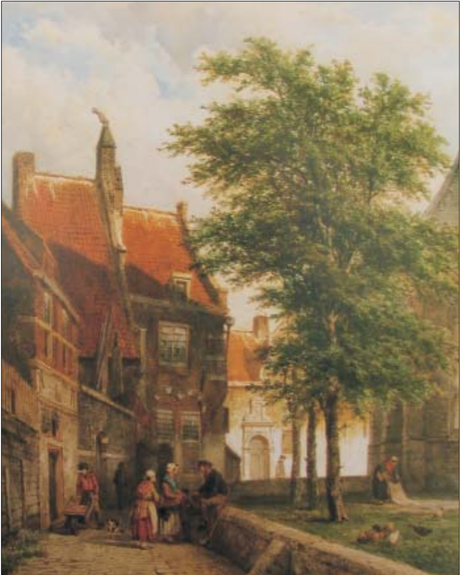
'Achter de kerk te Naarden', gemaakt door Cornelis Springer in 1861. Collectie Teding van Berkhout in het Teylers Museum te Haarlem.

Wij prijzen ons gelukkig met dit geromantiseerde beeld van het noordelijke Kerkpad dat door de kunstenaar in een juiste topografische setting is geplaatst. Het in het zonlicht staande pand in de Marktstraat met de monumentale deurpartij zal