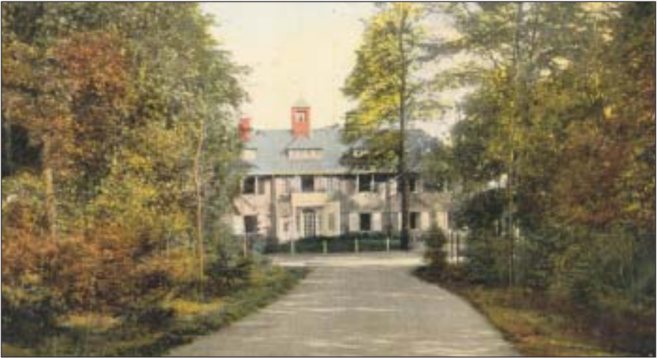
‘De Hinlopenlaan eindigde in een halfgrond plantsoen ...’ (Achteraan het na een bombardement in 1944 afgebroken hotel Het Bosch van Bredius).

het talud van het latere landgoed De Beek. Via de Amersfoortsestraatweg, die toen al heel lang de status van ‘rijksweg der eerste klasse’ had, ging onze koers naar de Hinlopenlaan waar we een smalspoor voor de mestlorries van de boerderij Oud Bussem passeerden. De karretjes werden getrokken door paarden. Aan de Hinlopenlaan trok het robuuste ijzeren hekwerk rond de houten villa van Floris Vos, de directeur van de modelboerderij Oud Bussem, altijd onze speciale aandacht: iedere paal was gesierd met een hoefijzer als geluksteken. De Hinlopenlaan eindigde in een halfgrond plantsoen met aan weerszijden linden. Het plantsoen diende als een soort voortuin voor het voorname hotel Het Bosch van Bredius, waarvan de ingang recht tegenover de Hinlopenlaan stond. Daar logeerden zoals men zei alleen de beter gesitueerden. Ze konden er, volgens de advertenties van het hotel, genieten van ‘een der schoonste en boschrijkste deelen van het Gooi’.