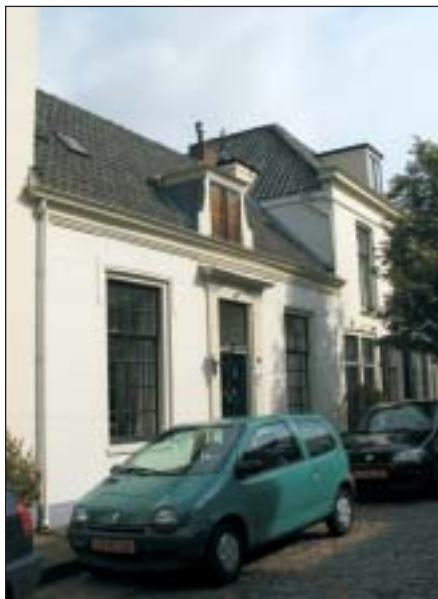
Het Hoefijser'. In 1700 een huis in de Voorstraat. Nu Turfpoortstraat 20.

'Edam' en 'De Twee Troffeltjes' aan één of meer panden in de Vesting. Van veel namen bleef echter de identiteit van het huis nog onbekend en die lieten we daarom maar heimelijk achterwege. Zo intrigeren ons al jaren 'De Pauw', een huis dat in 1707 in de Gijgelstraat (Sint Vitusstraat) stond. Of 'De Schildpad' uit 1782 in de Vrouwenstraat (Cattenhagestraat), een huis waar volgens een oude akte 'de schildpad in de gevel stond'. En niet te vergeten 'De Pispot', een huis dat in 1687 'aen de Wal' was gelegen, ook dat hebben we nog niet kunnen lokaliseren. Gaat het echter om nog oudere vermeldingen, zoals het 'Geert de Bolenshuis' uit 1507, dan tasten we helemaal in het duister.