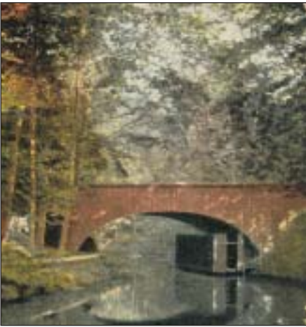
'... de stenen brug over de zanderijsloot.' (De fraaie schepping van architect De Bazel verbindt nog steeds de Oud Blaricummerweg met de Bollelaan).

De kei maakte standaard deel uit van de lommerrijke set waar dagjesmensen poseerden voor een professionele kiek ter herinnering aan een mooie zomerse dag in het bos van Bredius.