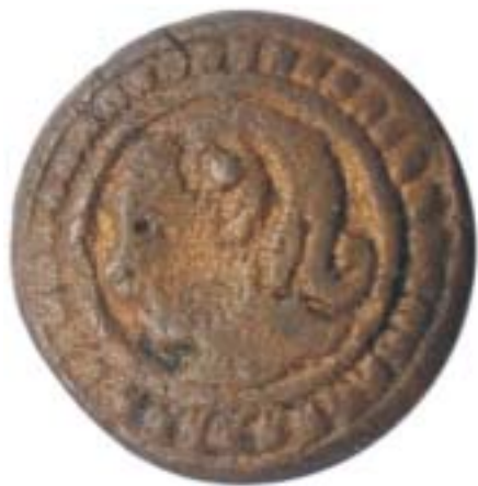
Vrouwenhoofd in parelrand. Ware grootte 12 mm.

Onder de in Naarden gevonden knopen bevinden zich ook drie exemplaren met afbeeldingen van vogels. Het zijn ware kunstwerkjes. Een knoop met daarop een roofvogel en haar jong lijkt uit nikkel te bestaan. Dergelijke knopen met een fraaie zilverglans moeten een prachtig effect hebben gesorteerd wanneer ze hun toepas-