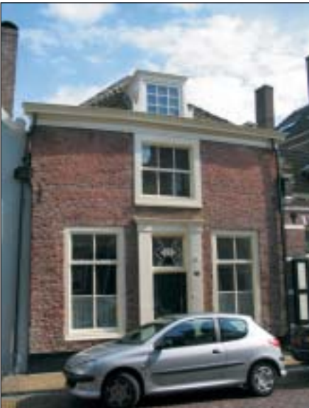
'De Blauwe Bijl'. In 1684 een huis in de Vrouwenstraat. Nu Cattenhagestraat 25.