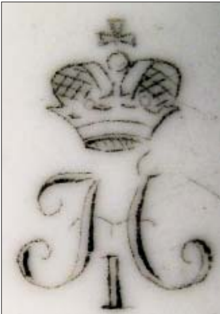
Het merk van tsaar Nikolaas I op de achterzijde van het bord.

Het merk op de achterzijde toont de letter H die echter de cyrillische N voorstelt. Met een kroon met kruis erboven en het cijfer 1 eronder, verwijst het teken naar Nikolaas I, die van 1825 tot 1855 tsaar van Rusland en tevens hoofd van de Russisch-orthodoxe kerk was.