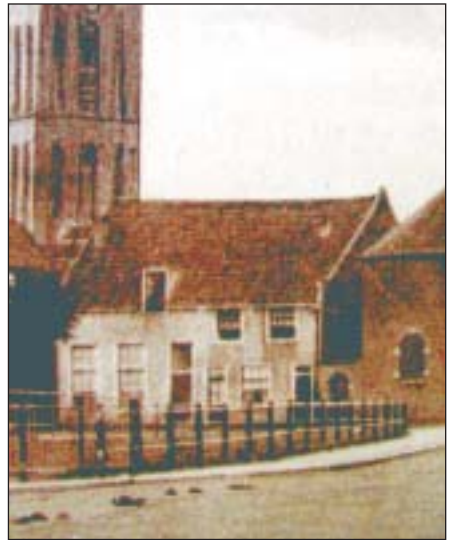
'De Swaan'. Stond in 1788 op de Binnenhaven (naast de Turfloods). Verdwenen.