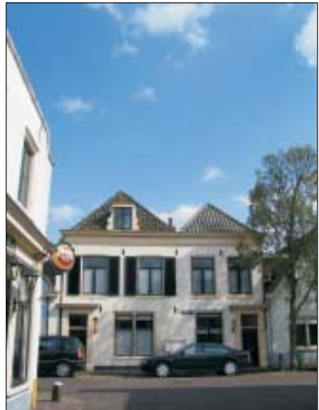
'De Roskam'. Genoemd in 1703. Nu Bussumerstraat 7 (met dakkapel).