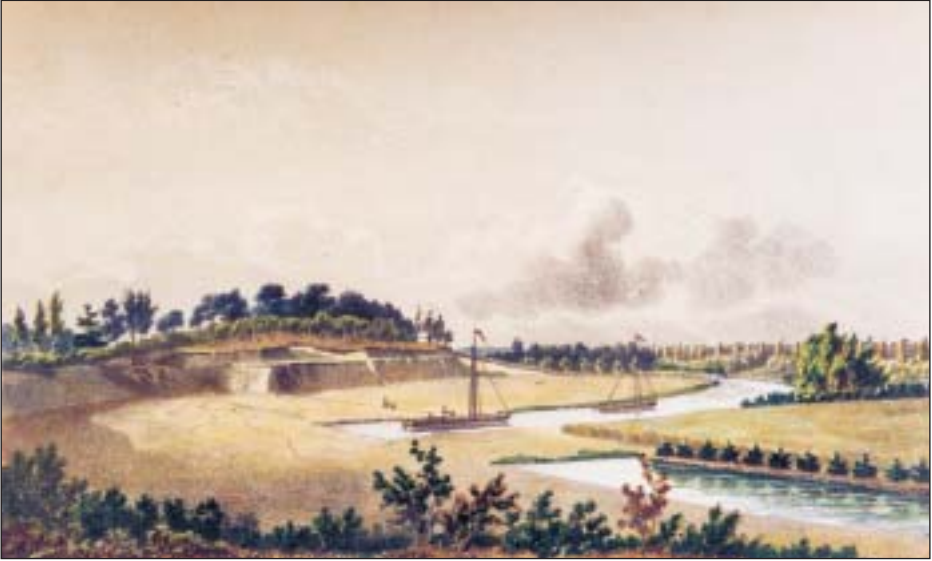
De Naarder Zanderij in vol bedrijf op een steendruk van Anthonius Brouwer.

lige belofte zich te houden aan Zijner Majesteits besluit, deze toch weer verder was gegaan.